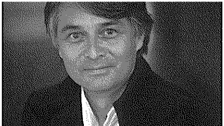
Jun Märkl, Conductor

私たちに出来ることは、彼らの尊い命を道半ばにして奪い取った“死”というものの存在を、音楽を聴くことで強く意識し、慰霊し、後世に語り継いでいくことだ。このような悲劇を二度と繰り返さないために。